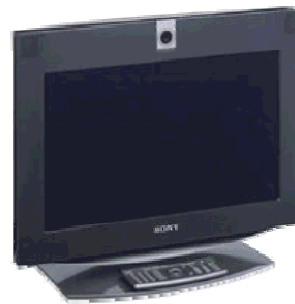
Sony TCS PL 50