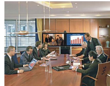
Polycom VSX System