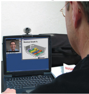
Polycom PVX-Client mit Webcam